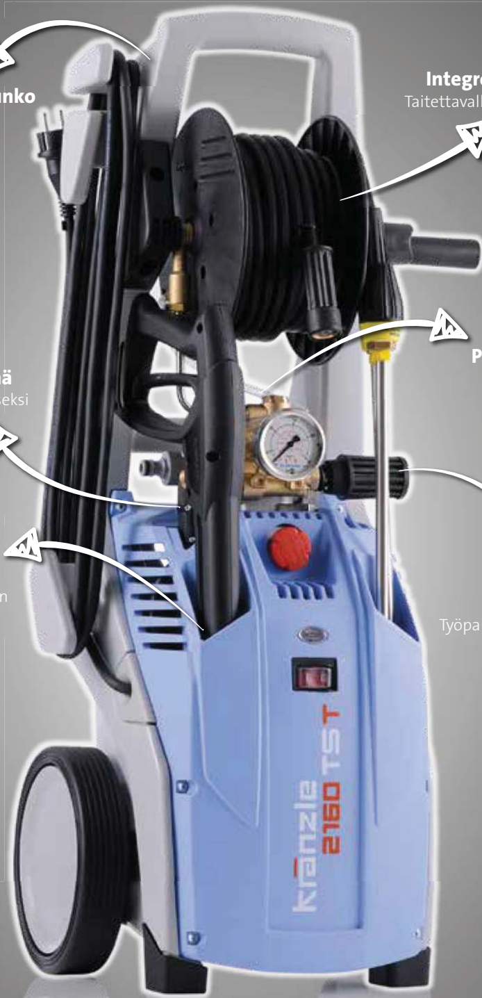
Kuvat: K 2160 TST

Paineensäätö Työpaine portaattomasti säädettävä